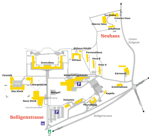
Bolligenstrasse 111, Bern Neuhaus, Ittigen